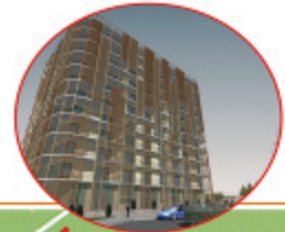
Olimp Resort Map - site location